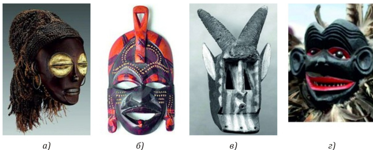
Рис. 2. Африканские маски: а) маска племени Чокве; б) маска племени Масаи; в) маска племени Догонов; г) маска бога Чевы

Фасады дома были решены в виде определенных масок четырех племен, проживающих на африканском континенте. Северный фасад – фасад плодородия (женское начало), символизирует маску племени Чокве (рис. 2а). Маска молодой женщины, которая олицетворяет молодое поколение девушек, посвящаемых во взрослую жизнь.