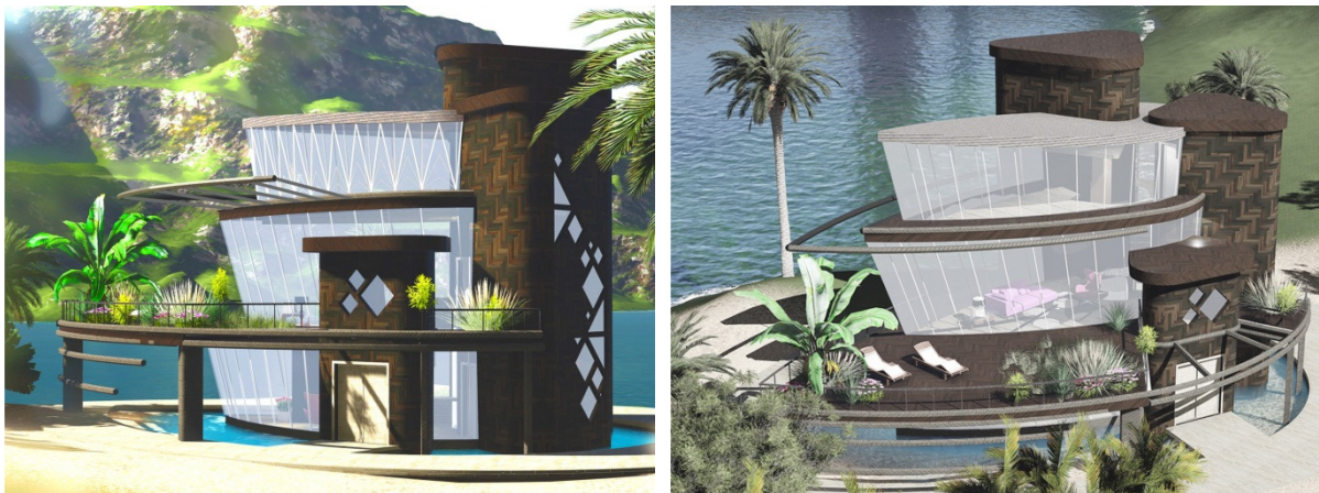
Рис. 7. Проект индивидуального жилого дома «The Mudina» К. Мамаевой, АГАСУ, Астрахань

Конфигурация оконных проемов и расстекловка выполнены в виде стилизации вариантов геометрических орнаментов, которыми украшаются традиционные жилища африканских племен. Отделка фасадов и цветовое решение является так же отсылкой к традиционным орнаментам и часто используемым геометрическим фигурам (рис. 7).