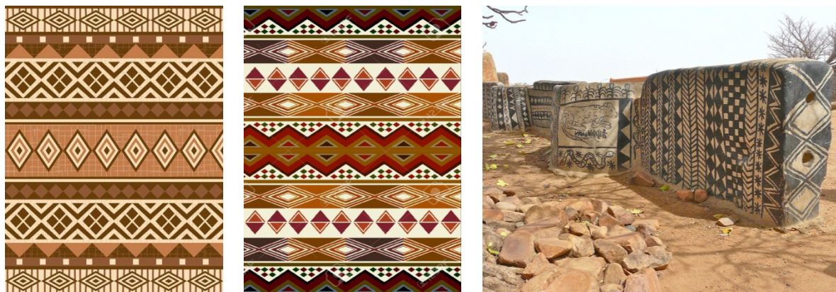
Рис. 4. Африканские орнаменты

связь с духами, чистоту и дружелюбие. Красный цвет считается цветом траура для одних племен, а для других - символом жизни и здоровья [2] (рис. 4).