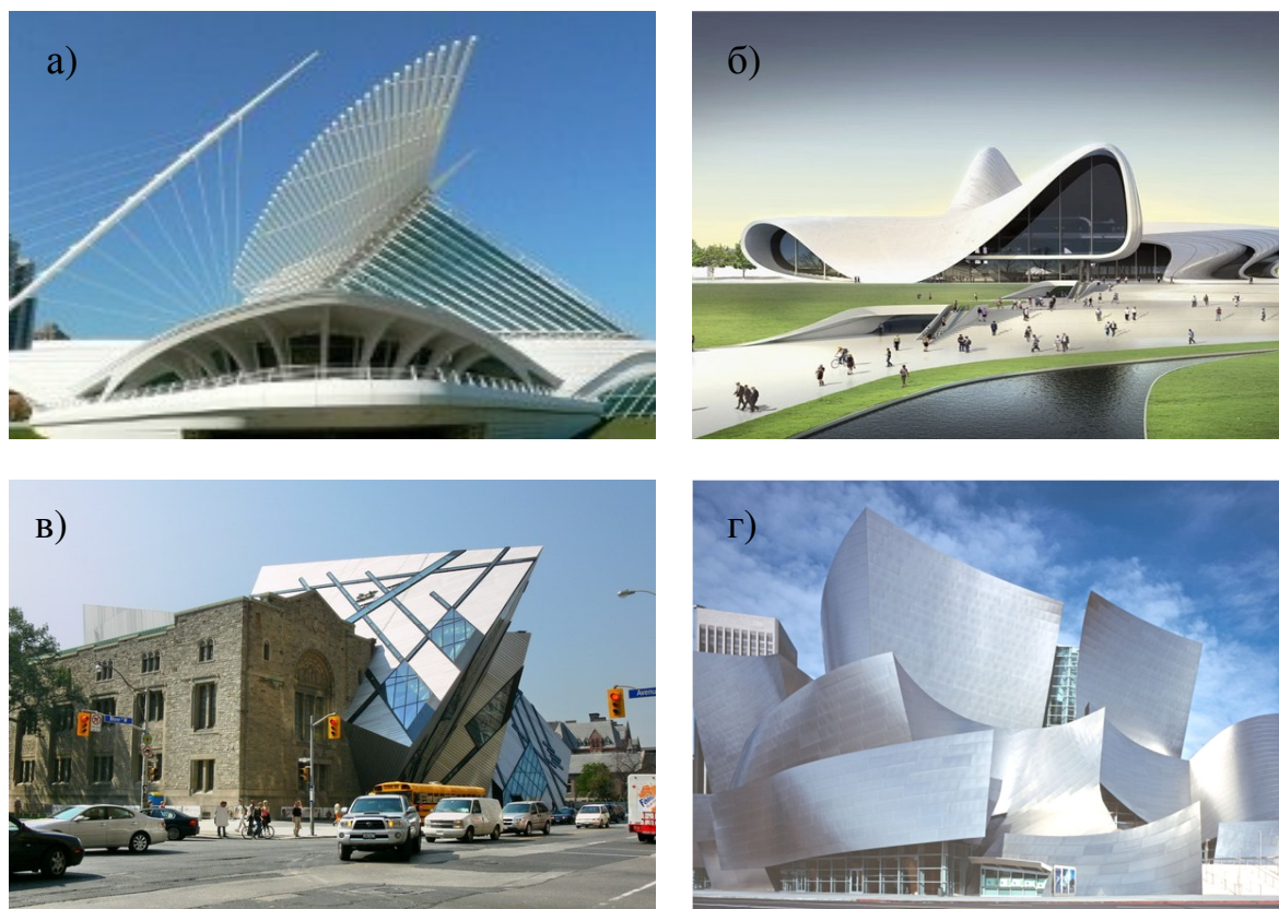
Рис. 1. Творчество архитекторов 21 века: а) С. Калатрава. Художественный музей в Милуоки, США; б) З. Хадид. Культурный центр Гейдара Алиева, Баку, Азербайджан; в) Д. Либескинд. Королевский музей Онтаро, Торонто, Канада; г) Ф. Гери. Музей Гуггенхайма, Бильбао, Испания

В современной архитектуре, как и в других сферах жизнедеятельности произошел процесс глобализации, при котором архитектурные объекты потеряли свои национально-культурные особенности. Мы привыкли видеть архитектуру либо типовой, либо авторской, где национальные принадлежности архитектора не имеют значения, а главенствует характерные черты формообразования архитектурного объекта. Наглядным примером служит творчество Сантьяго Калатравы, Захи Хадид, Даниэля Либескинда, Фрэнка Гери и др., концепции которых не основаны на национально-культурных особенностях региона (рис. 1).