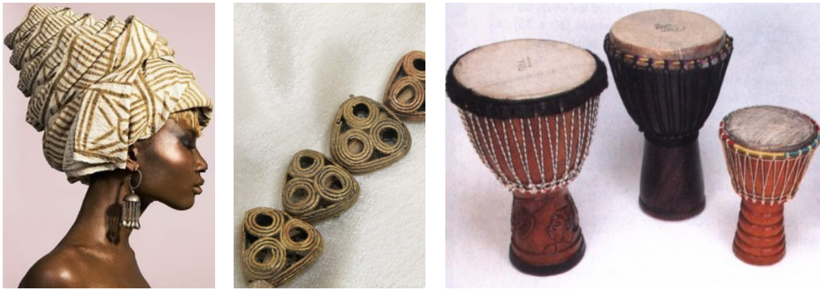
Рис. 6. Элементы национального колорита

За основу проекта были взяты особенности национального колорита, таких как одежда, украшения, музыкальные инструменты (рис. 6).