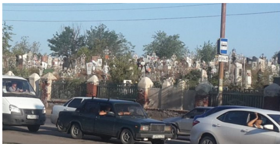
Рис. 6. Ограждение XIX в.