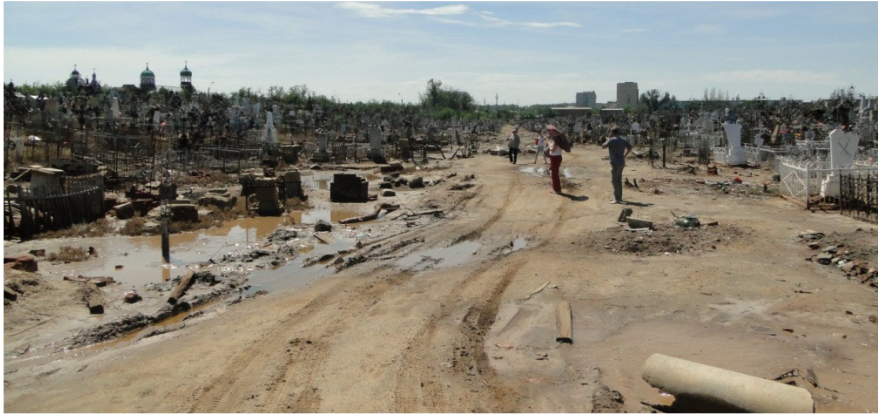
Рис. 2. Подтопление