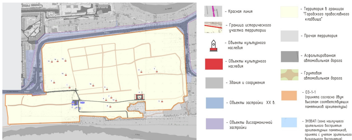
Рис. 1. Охранные зоны территории кладбища

По существующей топографической съемке была проведена работа с картографическими материалами. Были нанесены границы территории исследования и охранных зон по периметру, обозначено расположение охраняемых надгробий и мемориалов (рис. 1).