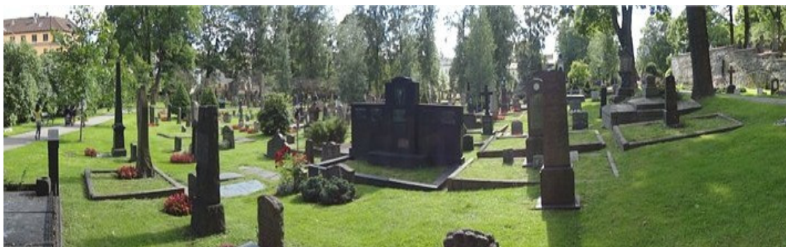
Рис. 8. Кладбище в Мангере

«Гамбургское кладбище Ольсдорферфридхоф считается самым большим парком-кладбищем в мире. Это кладбище Гамбурга больше напоминает огромный лес с чудесной природой и историческими захоронениями, расположенными на большом расстоянии друг от друга» [2] (рис. 9).