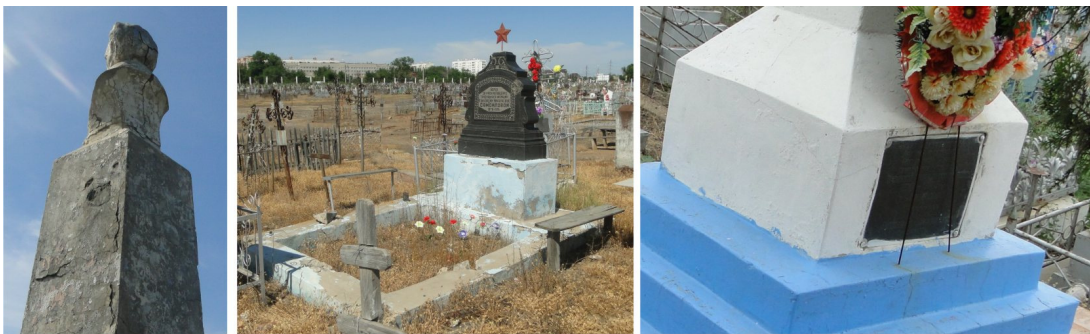
Рис. 4. Зафиксированные разрушения