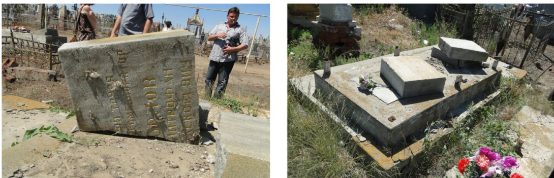
Рис. 5. Могила Орлова Ю.Д.