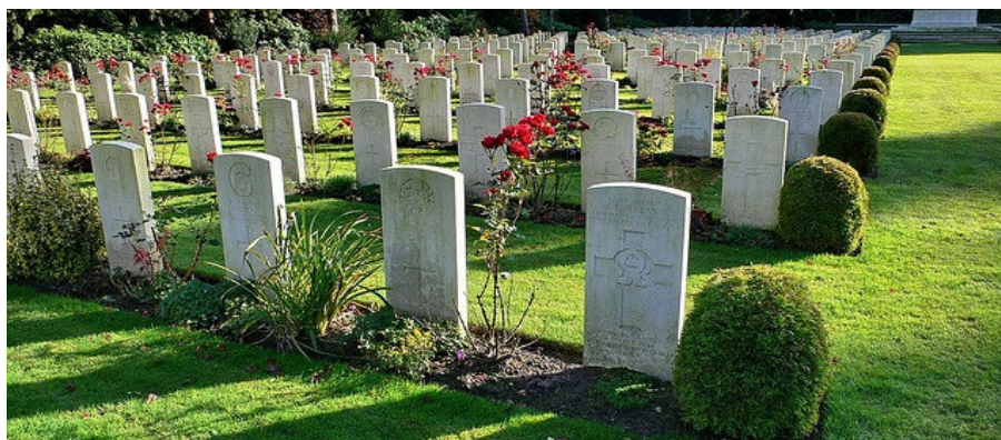
Рис. 9. Гамбургское кладбище Ольсдорферфридхоф