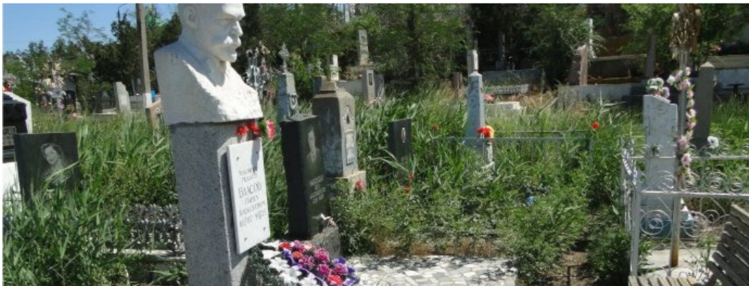
Рис. 3. Сорная растительность