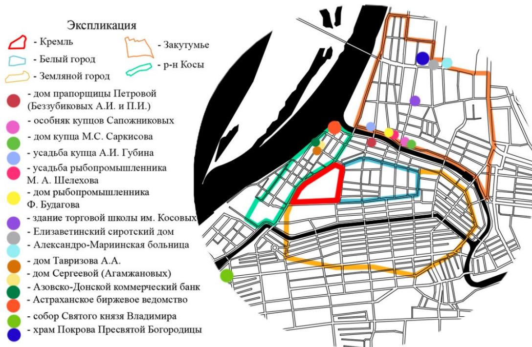
Рис. 3. Ориентиры II пол. XIX – нач. XX в.

На окраинах города среди деревянной малоэтажной застройки возводятся храмы, ставшие градостроительными доминантами: кафедральный собор Святого князя Владимира (район Татарской слободы), храм Покрова Пресвятой Богородицы (район Селенских Исад и бондарных мастерских на берегу Волги).