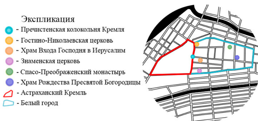
Рис. 1. Градостроительные ориентиры Белого города

Особое положение Астрахани на пересечении торговых путей определило здесь появление торговых представительств из разных стран. Так в Белом городе были построены подворья (Индийское, Персидское, Армянское, Татарское, Русский гостиный двор), занимающие территорию целого квартала с периметральной застройкой и внутренним двором. Не смотря на развитие торговой сферы в городе, главными ориентирами были культовые здания: церковь Рождества Пресвятой Богородицы, Спасо-Преображенский монастырь, Гостино-Николаевская церковь, храм Входа Господня в Иерусалим (доминанта Торговой площади), Знаменская церковь (рис. 1). Многие улицы были ориентированы на храмы и даже названы по наименованию церквей – Рождественская улица (была направлена к храму Рождества Богородицы), Никольская улица (вела от церкви Николы Гостиного к берегу р. Волги).