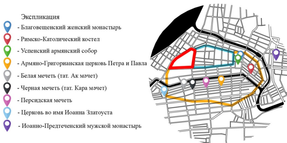
Рис. 2. Градостроительные ориентиры Земляного города

III этап. Земляной город сформировался на территории южнее Кремля и Белого города во II половине XVII века и включал стрельчатые и национальные слободы [4, с. 12,13], а также православные монастыри, которые защищали подступы к городу. Ориентиры Земляного города: Благовещенский женский монастырь (бывший Вознесенский мужской), Римско-Католический костел, Успенский армянский собор, Армяно-Григорианская церковь Петра и Павла, Белая мечеть, Черная мечеть, Персидская мечеть, церковь во имя Иоанна Златоуста (рис. 2).