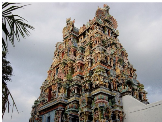
Рис. 3. Шикхара индуистского храма

архитектурная семиотика, где значение, смысл, композиция и конфигурация пространств, а также архитектурные конструкции и архитектурные детали рассматриваются как знаковая система, зафиксированная кодовая информация человеческой культуры. «Написание и прочтение» архитектурных знаков-образов вышло за рамки архитектурной образности, став одним из способов для коммуникативных процессов. К самым выразительным проявлениям архитектурного образа с позиции архитектурной семиотики относятся объекты культовой архитектуры.