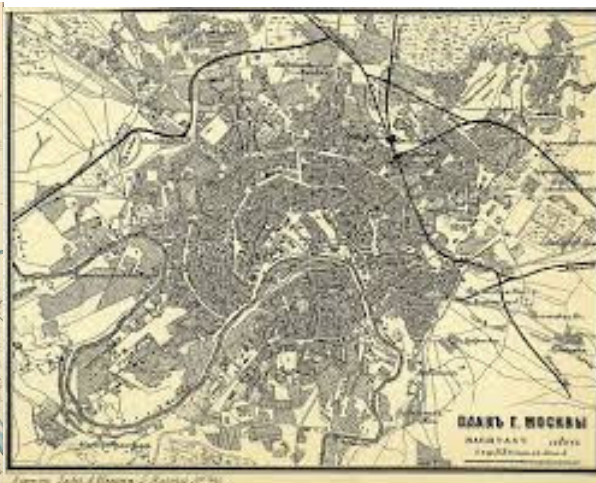
Рис. 2. План Москвы 1886 г.

По мнению ученого, между архитектурным моделированием и реальным архитектурным объектом лежит так называемое «посредующее звено», которое существует в культурной памяти и в ее кодирующих системах [4, с. 67–74].