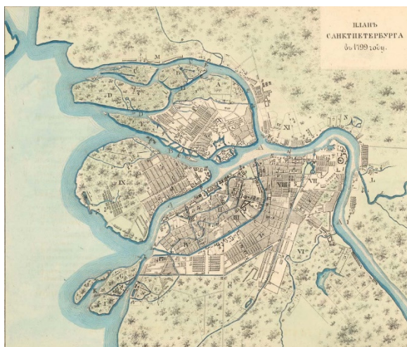
Рис. 1. План Санкт-Петербурга 1799 г.

Ярким представителем такого понимания и осмысления архитектурного образа является Ю. М. Лотман. На основе сравнения планировочной структуры двух российских столиц (Санкт-Петербурга и Москвы) периода восемнадцатого-девятнадцатого веков Ю.М. Лотман отмечает, что знаменитое «трехлучье» и открытые перспективы улиц в планировке центральной части Санкт-Петербурга декларирует идею разума и победы над природными стихиями, устремленность «вовне», то есть в Европу, в то время как планировка центральной части Москвы устремлена к Кремлю, «в себя».