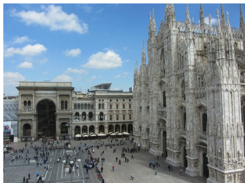
Рис. 2. Милан: собор Дуомо и опера Ла-Скала

Так же формируются и другие общественные пространства, такие как пассаж. Пассажи можно рассматривать, как типы торговых предприятий, которые связываются в элементы крупных торговых и развлекательных комплексов. Важным композиционным элементом пассажа является точка перехода из одной пространственной среды в другую: из внутреннего закрытого двора или атриума в торговый пассаж. Благодаря прозрачным перекрытиям пассаж можно отнести к многосветному пространству с постоянно меняющимся освещением, что меняет и оживляют среду. Внутреннее пространство пассажа представляет собой сложную структуру, которая не может рассматриваться как самостоятельный объект, но является единой частью городской среды, представляющей собой единый ансамбль [3]. Примером является достопримечательность Милана – собор Дуомо и опера Ла-Скала (рис. 2), которые соединяет известная галерея Виктора Эммануила 2 (рис. 3).