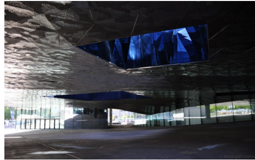
Рис. 3. Здание Форума в Барселоне