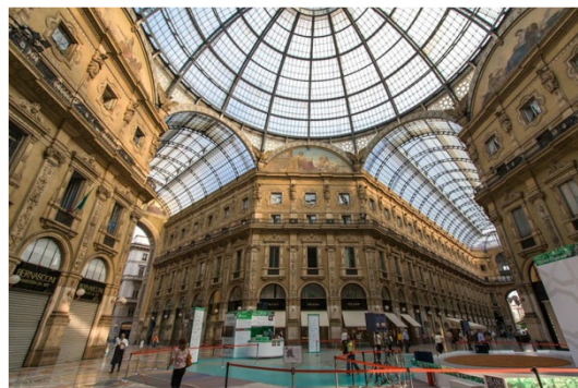
Рис. 3. Галерея Виктора Эммануила 2

Формирование «промежуточных пространств — это создание коммуникативных пространств, связывающие внешние и внутренние пространства здания. Такие пространства можно разделить по функциональному назначению: транзитные (коридоры, галереи); рекреации, предназначенные для отдыха и общения; природно-парковые рекреации; выставочные пространства. Буферное пространство можно рассматривать не только как пространства, объединяющие отдельные части между собой, но и как самостоятельные общественные пространства. Организация общественных внешних пространств, в структуре комплекса, на открытых территориях называются форумами. Такие пространства связывают по-своему функциональному назначению внешние пространства с внутренними. К таким зонам можно отнести: площадки перед входами, открытые двory, зоны для проведения массовых мероприятий, выставочные павильоны, концертно-зрелищные зоны на территории данного комплекса. Примером является здание Форума в Барселоне (рис. 3).