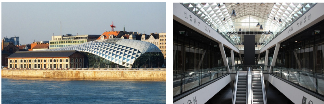
Рис. 1. Valna – стеклянный «кит» на берегу Дуная

Атриумы в общественных пространствах играют особую роль. Главная функция обеспечение верхним светом внутренних пространств, а также помещений с недостаточным боковым естественным освещением. Другая функция, служит для украшения зданий, являясь доминантой, центром комплекса, при этом оставаясь многофункциональным пространством. Примером служит здание в центре города Будапешт, Венгрия. Это современное здание на берегу Дуная имеет изогнутую форму тела кита (рис. 1).