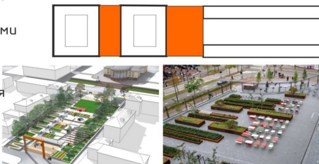
Рис. 4. Типы пространств по степени социального контроля

Скверы, дворы, территория перед входом в здание, место для отдыха, павильоны