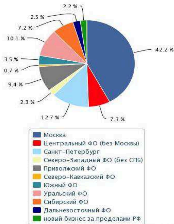
Рис. 1. Географическое распределение объема лизинговых сделок 2013 г.

В настоящее время есть немало причин говорить о продолжении интенсивного роста развития лизинга. Если упоминать факторы, которые препятствуют развитию рынка лизинга, то они основываются в особенности на нерешенные проблемы самого строительного бизнеса.