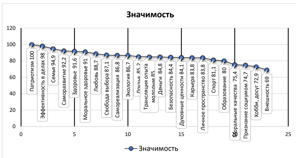
Рис. 3. Воспринимаемый уровень значимости ценности (N = 90, ср. значение)

Каждая из указанных респондентами ценностей получила усредненную оценку для группы по параметру удовлетворенности ее состоянием в диапазоне от 0 до 100 баллов и распределение по 5-бальной шкале уровня и представлена на рисунке 3.