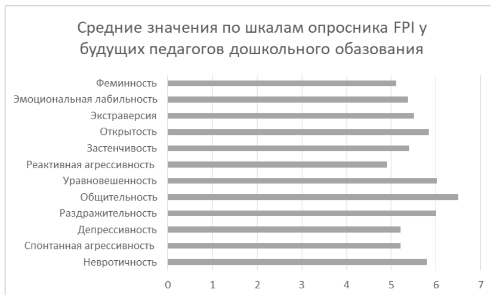
Рис. 1. Диаграмма средних значений по шкалам опросника FPI у студентов специальности «Дошкольное образование»

На первом этапе исследования были измерены личностные качества у студентов, обучающихся по специальности «Дошкольное образование» ( n = 45 , возраст: 17–18 лет, в основном 1 курс), были получены следующие результаты, представленные на рисунке 1.