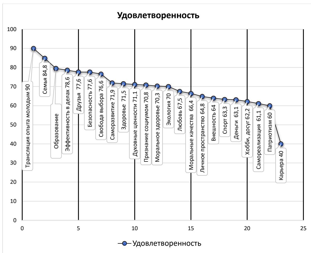
Рис. 4. Воспринимаемый уровень удовлетворенности ценностью (N = 90, ср. значение)

друзья и пр.), которые они транслируют в общей системе личностно-значимых сфер, что вполне нормативно для студенческого возраста и посредством практического применения в ходе подхода к повседневной жизни характеризуют набор ценностей направленных на выполнение определенного типа задач в последующей профессиональной педагогической деятельности. Примеры индивидуалистических ценностей со значительным перевесом предъявления в ответах включают самореализацию, такую как «достижение в жизни чего-то большего», «желание реализовать все свои усилия», «достижение поставленных целей», «осуществление личностного и профессионального роста», «уверенность в проявлении себя в какой-либо сфере» и др.