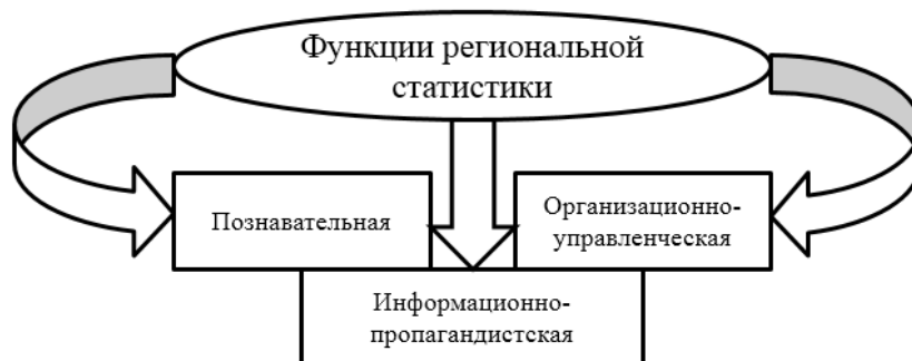
Рис. 5. Основные функции региональной статистики