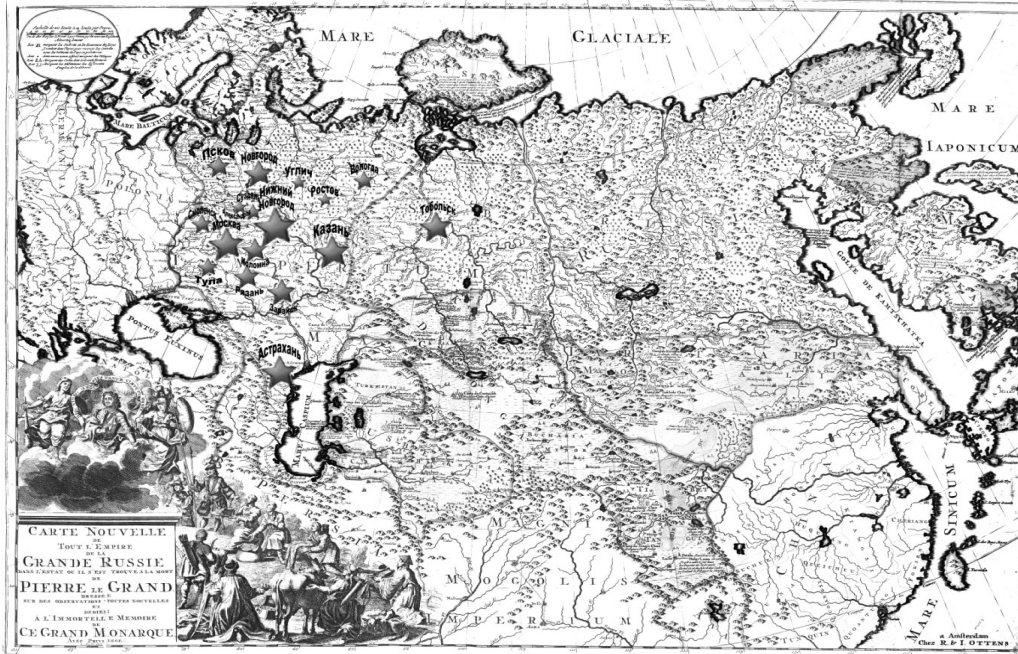
Рис. 1. Расположение кремлей на исторической карте

дель, духовный центр и средоточие власти. Кроме того, в случае внешней угрозы за кремлевскими стенами укрывалось все население города. Это обстоятельство также существенно отличает кремли от аналогичных комплексов.