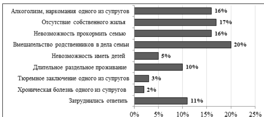
Рис. 1. Основные причины разводов в Астраханской области

Основными факторами, препятствующими разводу, по мнению опрошенных в отделениях ЗАГС Астраханской области респондентов, являются: невозможность «поделить» детей между родителями (14 %), сложности с разделом жилья, имущества (12 %), материальная зависимость, несамостоятельность одного из супругов (12 %), несогласие на развод одного из супругов