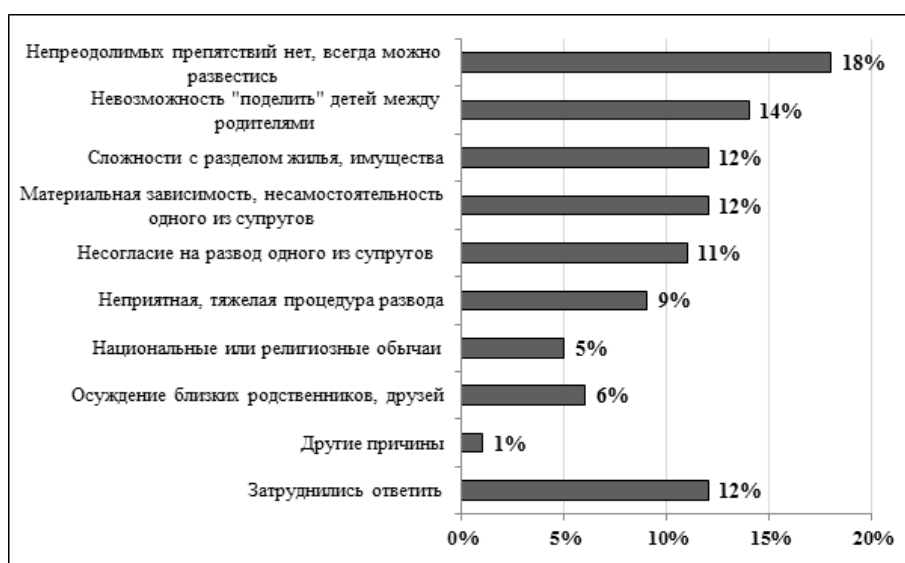
Рис. 2. Основные факторы, препятствующие разводу в Астраханской области

(11 %), неприятная, тяжелая процедура развода (9 %), осуждение со стороны близких родственников, друзей (6 %), национальные или религиозные обычаи (5 %). Но стоит отметить, что большинство опрошенных респондентов (18 %) уверены в том, что непреодолимых препятствий нет, всегда можно развестись [6] (см. рис. 2).