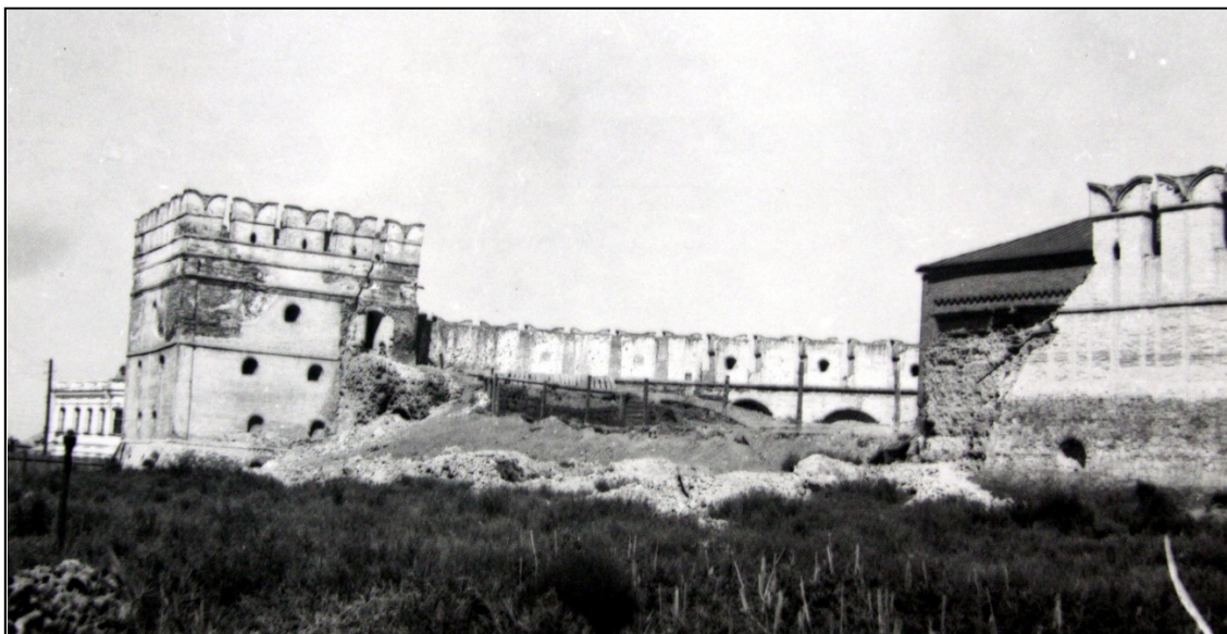
Рис. 1. Состояние прясла между Крымской и Житной башнями в 1950 г.

Известно, что к историко-архитектурным памятникам республиканского значения ансамбль Астраханского кремля был причислен в 1947 г. Но необходимость масштабных реставрационных работ осознали лишь через два года – после обрушения участка зубчатых стен между Житной и Крымской башнями (рис. 1). Спустя еще десять лет начались системные работы по воссозданию и реставрации объектов кремля. Сообщение между кремлем и прилегающей территорией стало обеспечивать в основном через главную проездную башню, проход через другие башни на различные периоды ограничивался.