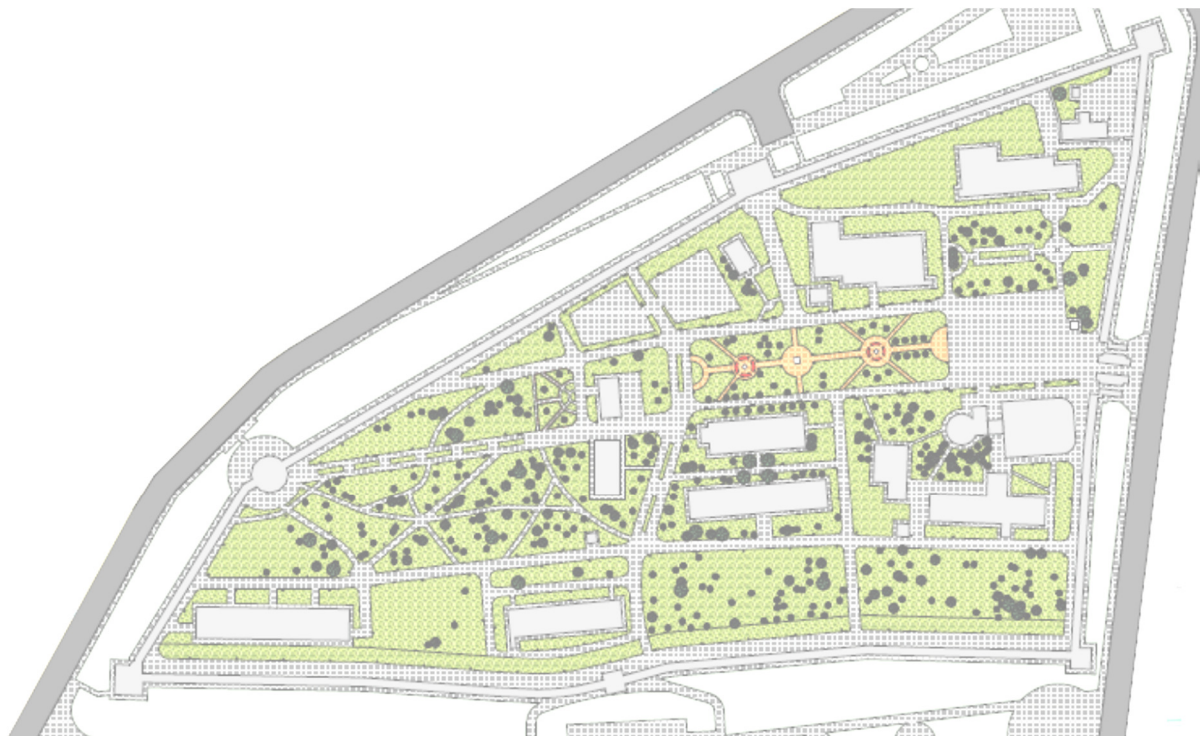
Рис. 4. Вариант благоустройства кремля на текущий период