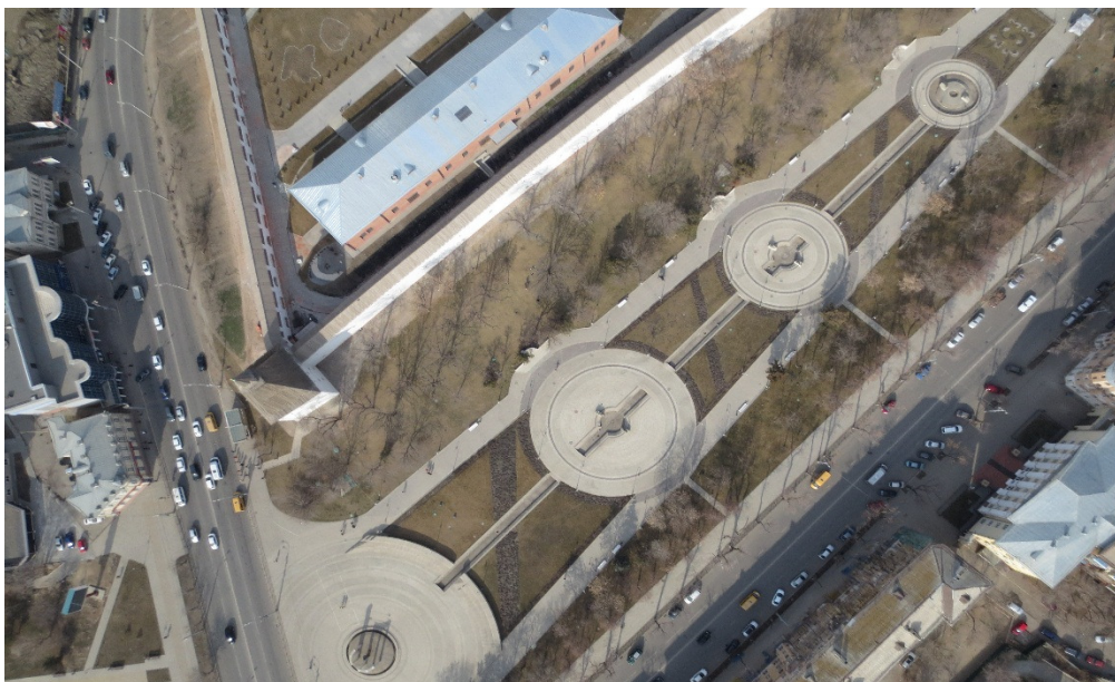
Рис. 5. Крымская башня с высоты птичьего полета в настоящее время

зано непосредственно на сохраняемые элементы зубчатых стен кремля. Осуществление этого варианта возможно только на основании утвержденной проектной документации. Согласно положениям ст. 28 Федерального закона от 25 июня 2002 г. № 73-ФЗ «Об объектах культурного наследия (памятниках истории и культуры) народов Российской Федерации», в целях определения степени соответствия проектной документации и производственных работ нормативным требованиям к сохранению объекта культурного наследия проводится государственная историко-культурная экспертиза. Положение о государственной историко-культурной экспертизе утверждено постановлением Правительства РФ от 15 июля 2009 г. № 569.