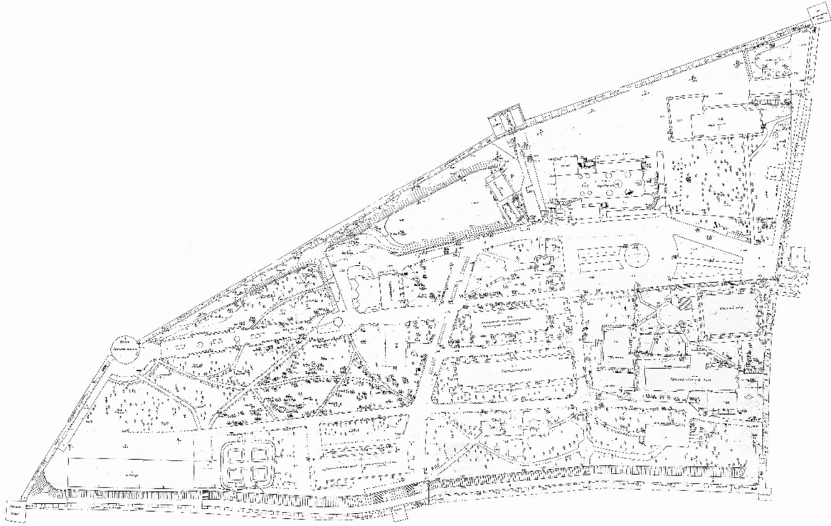
Рис. 3. Топографический план Астраханского кремля (кон. XX – нач. XXI в.)