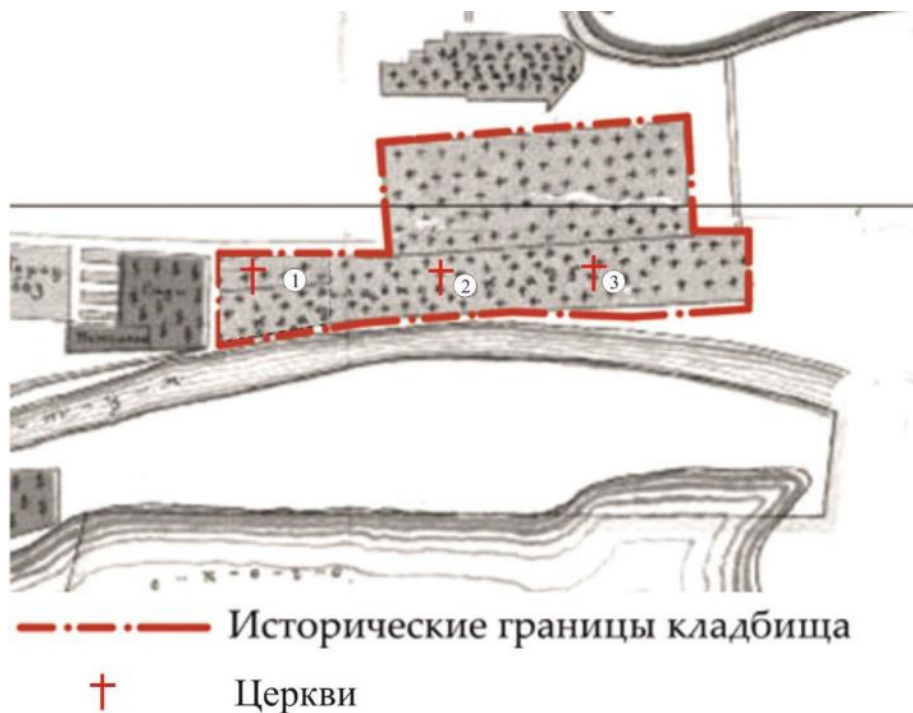
Рис. 2. Исторические границы кладбища на карте до 1925 г. [3]

Часть территории городского православного кладбища была присоединена к Афонскому кладбищу, названному в честь стоявшей там церкви св. Афанасия Афонского. Эта территория ввиду удобства расположения (близости к центру города) быстро стала единственным официальным кладбищем г. Астрахани, погребения на котором осуществлялись достаточно долго (рис. 2).