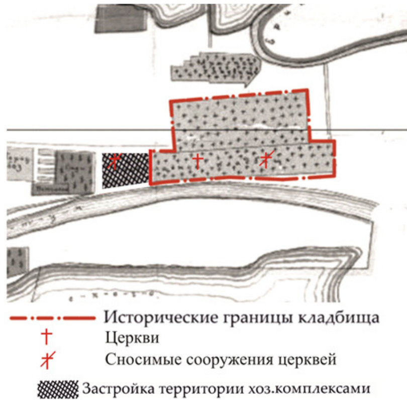
Рис. 3. Исторические границы кладбища после 1925 г. с указанием территории, попавшей под программу рекультивации [3]