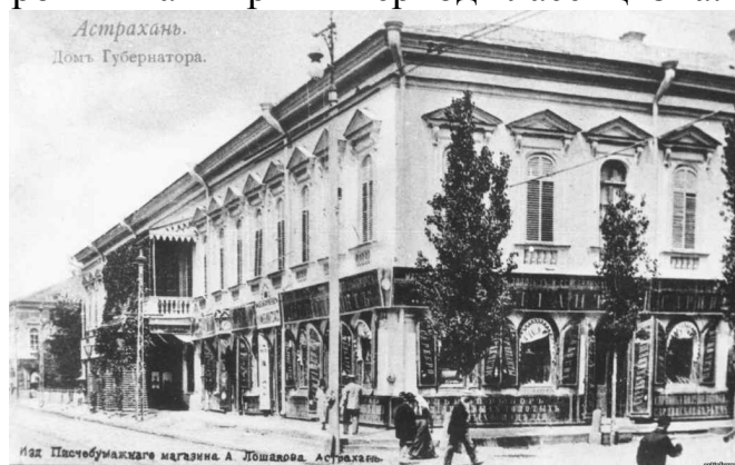
Рис.4. Дом Губернатора. Астрахань

На смену классицизму в архитектуре появляется совершенно новый стиль Ампир. Карло Деперди работал в это время в Астрахани, основные и наиболее значимые работы его работы – бывшая Полицейская управа, ансамбль больницы Приказа общественного призрения, бывшая калмыцкая управа. В 30-40 годах XIX века по проекту итальянского зодчего на Паробичевом бугре появляются Больничные сооружения, являющиеся образчиком ансамблевой застройки в ампирный период классицизма.