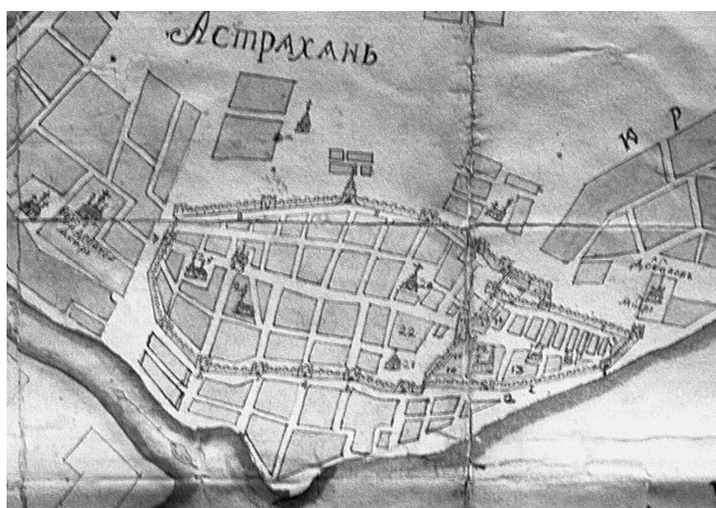
Рис. 1. План Астрахани 1720 г.

На протяжении долгого времени законодательницей архитектурной моды для Руси была Византия. Ареал распространения византийской культуры простирался далеко за границы империи. Вплоть до XV века она занимала ключевые посты в мировом господстве. Но уже близок был ее закат. Италия становится главным поставщиком архитектурной красоты. Так начинается первый «итальянский» этап в русской архитектуре. Иван III активно приглашает итальянских архитекторов для реализации масштабных проектов переустройства и строительства Москвы и других русских городов. Целая артель итальянских архитекторов и инженеров едет решать архитектурные задачи русского царя: это Аристотель Фьораванти, Пьетро Антонио Солари, Марк Фрязин, Бон Фрязин, Алевиз Старый, Антон Фрязин и другие. Второй этап влияния итальянской архитектуры связан с именем Петра I. Желание императора перестроить все на европейский манер привело к изменению внешнего и внутреннего уклада русских городов и в первую очередь столицы. Россия за короткий срок становится одной из ведущих держав. Петр I понимает стратегическое значение городов форпостов. Готовясь к Персидскому походу, он снаряжает экспедицию в Астрахань. К этому времени Астрахань представляла собой город с мощным фортификационным сооружением, где постройки в архитектурном плане во многом были самобытные (Рис.1).