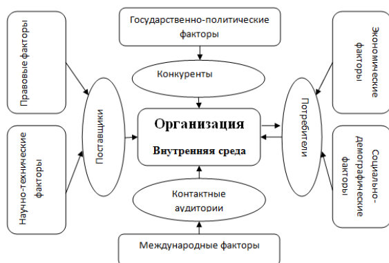
Рис. 2. Функционирование организации с внешней и внутренней средой

Если обобщить все факторы внешней и внутренней среды функционирования фирмы, мы получим схему, представленную на рисунке 2.