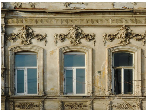
Рис. 4. Окнами второго этажа с маскаронами (гирляндами) [2]

Окна третьего этажа арочной формы, замковые камни украшены маскаронами. Над окнами второго этажа так же имеются маскароны (гирлянды) (рис. 4).