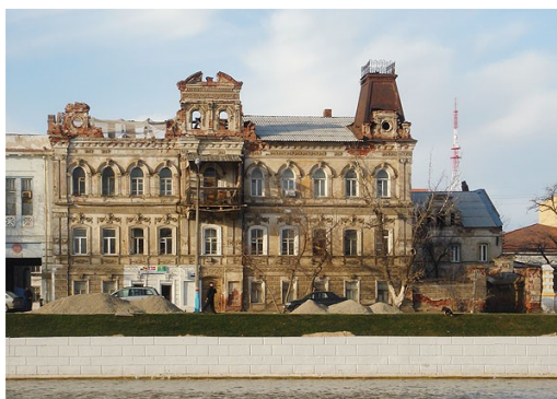
Рис. 2. Памятник регионального значения Дом купца М. С. Саркисова [2]