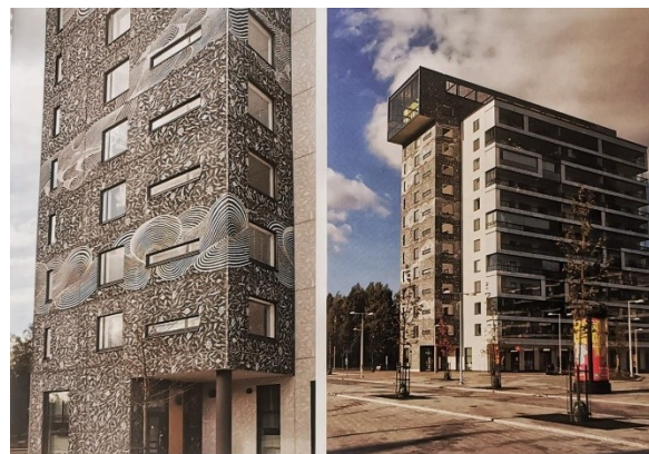
Рис. 2. Мотивы природы (волны и рыбы) для оживления монотонного бетонного фасада. Финляндия [4]

Здесь каждый житель «включается» в дизайн, стираются границы между профессионалами и населением в «формате открытого участия жителей в событиях, влияющих в итоге на облик финских городов» [4]. Нефедов на примере Финляндии демонстрирует пример бережного отношения к традициям и природе в создании комфортной среды, формирующей через источники креативного развития, которыми являются любые элементы проектного творчества и дизайна – игрушки, мебели и интерьеров, архитектуры, городского и ландшафтного дизайна, способность ценить красоту и любовь к своей родине у соприкасающегося с ней подрастающего поколения.