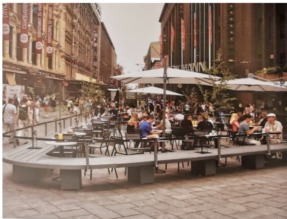
Рис. 1. Дизайн улицы как средство диалога с населением в Финляндии [4]

развития в интеграции природы с архитектурой в любом финском поселении, будь то столица или деревня. «Природа постоянно остается для финнов неисчерпаемым ресурсом для вдохновения. Благодаря умению видеть и чувствовать ее красоту у них проявляются многие идеи, корнями уходящие в многообразие форм национального ландшафта» (рис. 2).