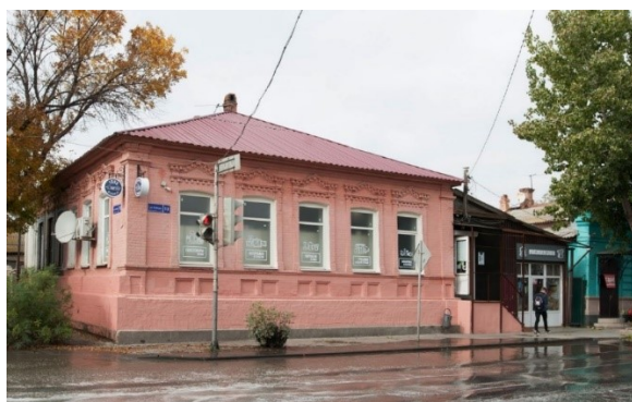
Рис. 5, 6. Первый опыт применения дизайн-кода в Астрахани (до и после) [11]

Городская среда также не может существовать без горожан и вне политических и экономических процессов, она не может быть статичной. Горожане и гости города формируют идентичность через традиции, воспоминания, рассказы, легенды, праздники и физическое отношение к городу. Исходя из этого, мы делаем вывод, что облик городского интерьера составляется из ряда воспринимаемых человеком отраженных в его мозгу представлений – картин, рассказывающих об объектах, ограничивающих и «создающих» видимое глазу пространство. Городской пейзаж – это сложная структура, которая является результатом взаимодействия человека с окружающей средой.