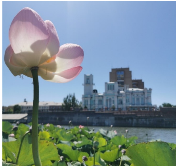
Рис. 4. Символы Астрахани – лотос орехоносный и здание ЗАГС (бывшая биржа).

лагается, что архитектурно-градостроительное наследие является четким показателем городской идентичности, и, следовательно, сохранение его является одной из основных проблем устойчивости городской идентичности. Конечно, невозможно и бессмысленно защищать все «старые» здания и сооружения. Города растут быстрее, чем ожидалось, и часто необходимо реструктурировать и реорганизовать существующую историческую среду для создания целостного образа, связывающего историю и современность.