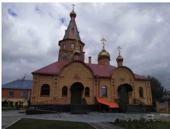
Рис. 9. Храм Троицы Живоначальной

Храм Троицы (рис. 9) – это пример современной православной архитектуры. Строительство было завершено в 2019 году. Храм двучастный, с двумя молеельными местами и алтарями на существующем фундаменте. В здании выделено два блока. Один из блоков имеет шатровое завершение, а у второго – скатная крыша с надстройкой главки. Храм общей площадью 734 м 2 , рассчитанный на 300 прихожан. Здание имеет асимметричную композицию.