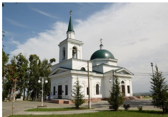
Рис. 10. Храм Иоанна Предтечи

аскетично. На восточном фасаде располагается икона, а на стенах находятся пилястры.