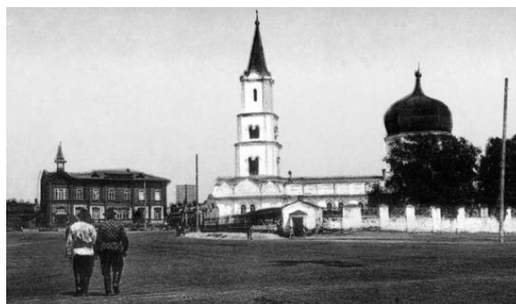
Рис. 1. Петропавловский собор (1774–1935 гг.) на Соборной площади (с 1933 г. – пл. Свободы)

Первый каменный собор Петропавловский, названный в честь святых Петра и Павла, был возведен в Барнауле 1771–1774 годах по проекту московского архитектора Д. П. Макулова [4].