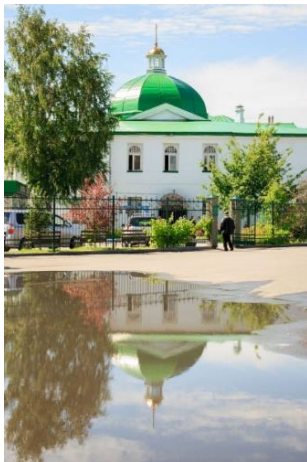
Рис. 2. Церковь Д. Ростовского

Можно констатировать тот факт, что до сегодняшнего дня в Барнауле сохранились лишь единичные памятники культовой архитектуры. Восстановлена разрушенная церковь Димитрия Ростовского [2].