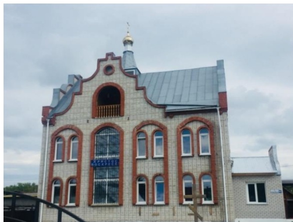
Рис. 7. Храм Преображения Господня

Ежегодно увеличивается число прихожан не только в Барнауле, но и по всей России. Поэтому, помимо восстановления имеющихся, очень актуальна тема строительства новых культовых сооружений. Часто можно встретить объекты гражданской архитектуры, отданные под храм. В июне 2014 года недостроенный дом в Борзовой Заимке, расположенный по улице Радужная, 91, напомиавший местным жителям церковь, был передан епархии. Был зарегистрирован приход Храма Преображения Господня (рис. 7).