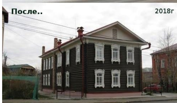
Рис. 1. 1) пр. Фрунзе, 32а. «КОДЕ», штаб компании по разработке ПО; 2) ул. Пушкина, 5. «Регион ДСК», поставщик пластиковых окон

24 мая 1996 г. президент Российской Федерации Борис Ельцин издал указ о Федеральной комплексной программе развития малых и средних городов Российской Федерации в условиях экономической реформы в целях